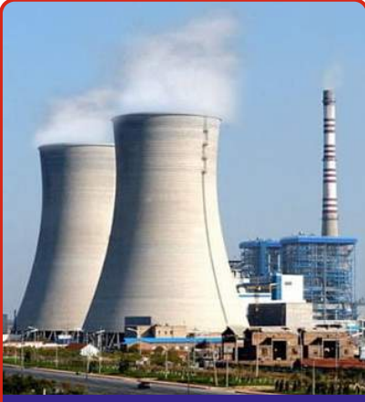
Enerji Santrali Tesisi