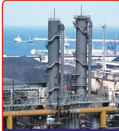
Demir Çelik Tesisleri