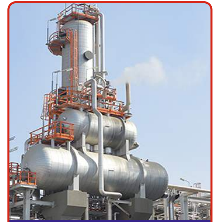
Gübre Üretim Tesisi