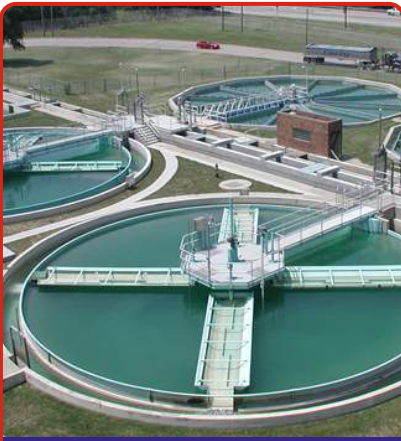
Su Arıtma Tesisleri